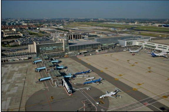
A. De luchthaven van Zaventem