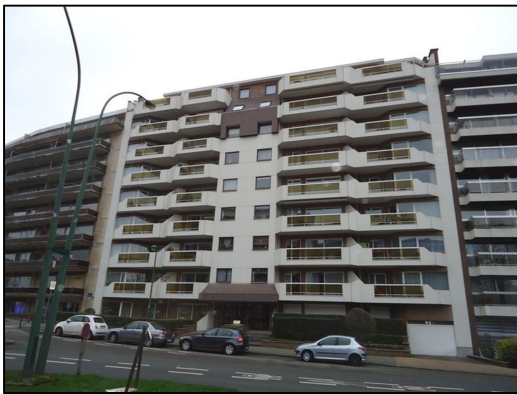
C. Appartementen in Molenbeek