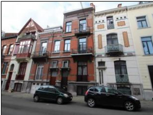
E. Kuregemstraat Brussel