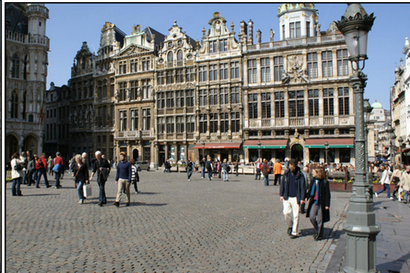
B. Grote markt van Brussel