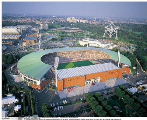
D. Koning Boudewijnstadion in Laken